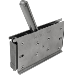
Ferramentas de suporte da Roxtec